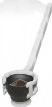
K30-1520 サージカルワイドフィールドレンズWHD

単回使用のサージカルゴニオレンズです。4枚64°のミラーを配置することで回転させることなく、前房隅角全周を観察することができます。 倍率:0.8x