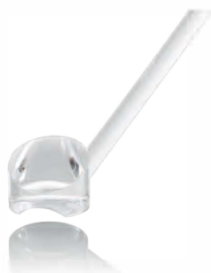
K30-1400 サージカルゴニオプリズム RH

単回使用検査用コンタクトレンズです。高透過率/反射防止コーティングのレンズを採用し、非常に明るくクリアな眼底像を提供します。各レンズは安心して便利な滅菌済みパッケージです（10個入り）。ディスプレイ製品ですので、一回限りの使用になります（再使用不可）。